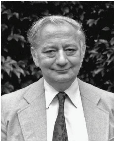
شکل ۱-۳ دونالد برودبنت

دو گوشی ۴ می‌نامند). برودبنت این‌گونه توانست برخی از محدودیت‌های اساسی توجه انسان را ثابت کند، و توانست یافته‌هایش را در کمک به عملکرد خلبان‌ها و کنترل‌کننده‌های ترافیک هوایی (که اغلب مجبورند هم‌زمان با دو یا چند اطلاعات ورودی سروکار داشته باشند) به کار گیرد. برودبنت (۱۹۸۰) عنوان کرد که مشکلات زندگی واقعی باید به‌طور ایده‌آل نقطه آغازینی برای پژوهش‌های شناختی باشد، چراکه این حالت باعث اطمینان می‌شود که یافته‌های پژوهش‌ها در زندگی واقعی، معتبر (و احتمالاً مفید) خواهد بود.