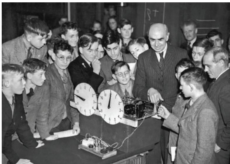
شکل ۲-۱ سر فردریک بارتلت در حال نشان دادن یک مدل به بچه‌ها در مؤسسه رویال در سال ۱۹۴۹.

اولین پژوهشگران شناختی بیشتر با پژوهش‌های محض ۴ سروکار داشتند، و هرگونه کاربرد عملی یافته‌های آن‌ها به‌طور عمده تصادفی بود.