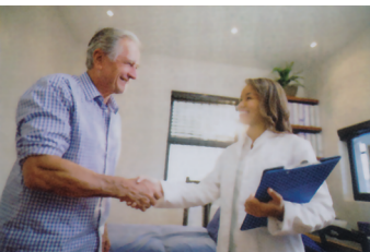
شکل ۱-۵. خوش آمدگویی به بیمار و برقراری ارتباط.

فصل ۵ را ببینید. استدلال بالینی، ارزیابی و برنامه‌ریزی برای بحث در مورد لیست مشکلات بیمار