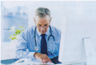
شکل ۱-۴. مرور گزارش سلامت قبل از مواجهه بالینی

فصل ۲، مصاحبه، برقراری ارتباط و مهارت‌های بین فردی را جهت بحث در مورد جمع‌آوری گزارش الکترونیک سلامت (EHR) در مصاحبه بیمار محور ببینید.