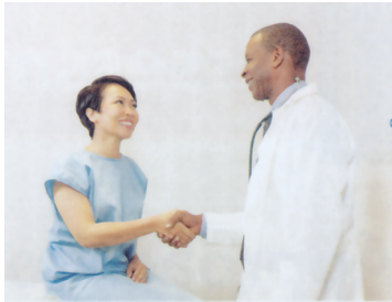
شکل ۱-۱. وصلت درمانی بین پزشک و بیمار

ارتباطات مراقبت از بیمار، پاداش‌های بی‌انتهای در حرفه بالینی را به دنبال دارد. این موارد الگوهای اساسی تمامی مراقبت‌های بالینی هستند.