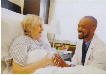
شکل ۱-۳. برطرف کردن موانع فیزیکی از مسیر و نشستن هم‌سطح بیمار

می‌شود. اگر شما بین بیمار و یک چراغ روشن یا پنجره بنشینید، ممکن است بیمار مجبور شود به منظور دیدن شما چشمان خود را تنگ کند که شبیه محیط بازجویی شود.