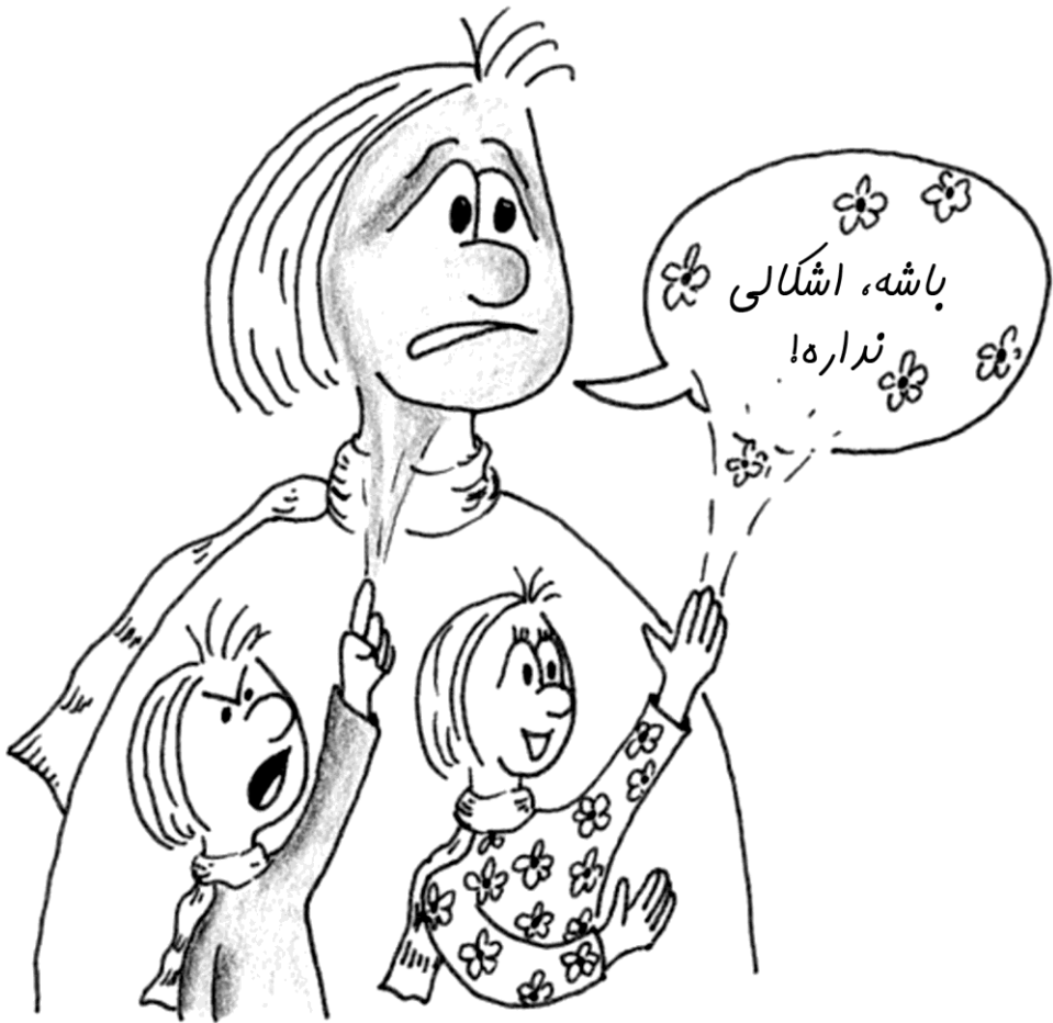
تصویر ۵: دو پیام ناهمخوان حاکی از وجود دو حریف درونی

از این پس من به جای «روح‌های درونی» از «اعضای تیم درونی» صحبت می‌کنم، تا حاملان این نداها را مشخص کنم، زیرا همه‌چیز به این بستگی خواهد داشت، که آیا و چطور می‌توان این نیروهای در ابتدا ستیزنده و مقاوم را به مساعی مشترک تألیف داد، به طوری که «حاصل» این اشتراک مساعی پرتوان‌تر و مناسب‌تر از وقتی بشود که فقط یک ندا به تنهایی حق بیان دارد. این موضوع یکی از اندیشه‌های اصلی این کتاب است و ما آن را همچنان در این کتاب دنبال خواهیم کرد. اما بگذارید در اینجا نخست با شیوه کارِ مختصِ مدل تیم درونی آشنا شویم.