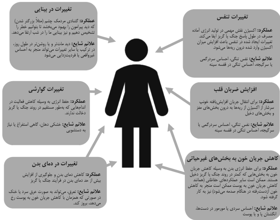
شکل ۱-۱. اثر سیستم عصبی خودکار

عصبی سمپاتیک به صورت همه یا هیچ ۱ عمل می‌کند؛ یعنی زمانی که این سیستم فعال باشد، فارغ از اینکه در چه موقعیتی قرار دارید، همه یا بسیاری از سیستم‌هایی که به شما برای جنگ با خطر و تقابل یا فرار / بیرون رفتن از آن خطر کمک می‌کنند فعال خواهند بود. این موضوع، علت تجربهٔ بیش از یک نشانهٔ جسمی در مواجهه با اضطراب را تشریح می‌کند. برای مطالعهٔ بیشتر در زمینهٔ پاسخ جنگ یا گریز، می‌توان به مقالهٔ موجز بارلو و کراسکه اشاره کرد. به شکل ۱-۱ نگاهی بیندازید تا با برخی از دیگر تغییرات بدنی در زمان فعال‌سازی سیستم عصبی سمپاتیک در خلال پاسخ جنگ یا گریز آشنا شوید.